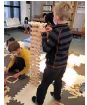
つみ木で遊ぶ子ども達