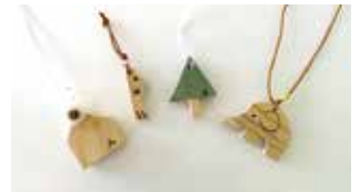
ペンダント・ストラップ