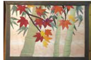
額装されたパッチワーク作品