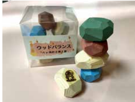
昨年の木育ワークショップで製作した ウッドバランス