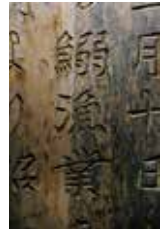
鰯漁業 新納屋地区 石碑 (撮影:2022年7月27日)