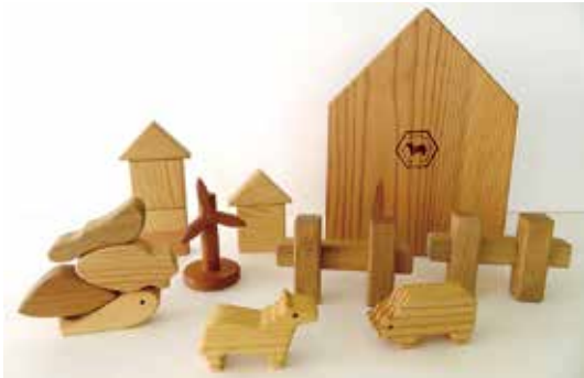
六ヶ所村のつみ木「MY VILLAGE」

今年度も11月26日土曜日に郷土館にて木育ワークショップを開催しますので、ぜひ木をとおして親子一緒に楽しい時間を過ごしてみませんか。