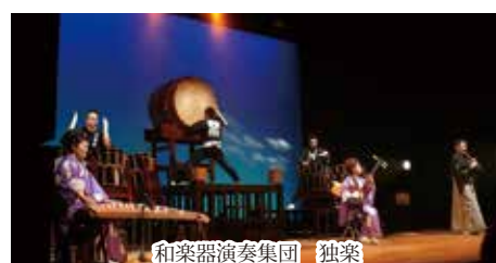
和楽器演奏集団 独楽

7月13日、大ホールで村内小中学校を対象とした鑑賞教室「和楽器演奏集団独楽コンサート」が開催されました。演奏者の絶妙なトークと迫力あるパフォーマンスはすぐに子供たちの心をつかみ、用意された体験コーナーでは子ども達もステージにあがり、リズムよく太鼓を鳴らすと、会場からは大きな拍手が起こるなど大いに盛り上がりました。