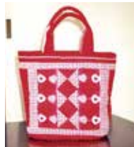
パッチワークのバッグ

今年度から郷土館で活動を再開したパッチワークサークルの皆さんの作品展です。長年創作に励んできた作品を一堂に展示します。1針1針心を込めて丁寧に縫われた作品をぜひご覧ください。