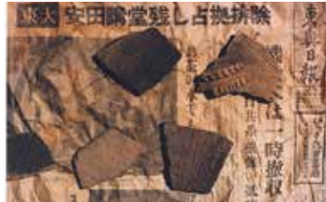
安田講堂残し占拠排除 1969(昭和44)年1月19日東奥日報 (撮影:2022年5月18日 青森県六ヶ所村)

様々な場所で県立美術館の活動をPRする事業「美術館堆肥化計画」が今年も村立郷土館で開催！写真家・田附勝氏が郷土館所蔵の縄文土器の欠片や村の風景を撮り下ろした写真を、郷土館の常設展示室や地下倉庫で所蔵資料とともに展示します。郷土館と写真家による気鋭のコラボレーションが刻む、村の新たな歴史を目撃してください。