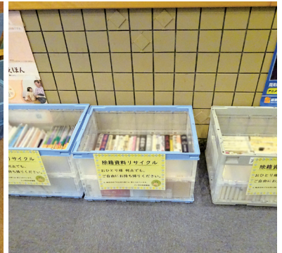
※リサイクル本の転売目的でのお持ち帰りは禁じられています。