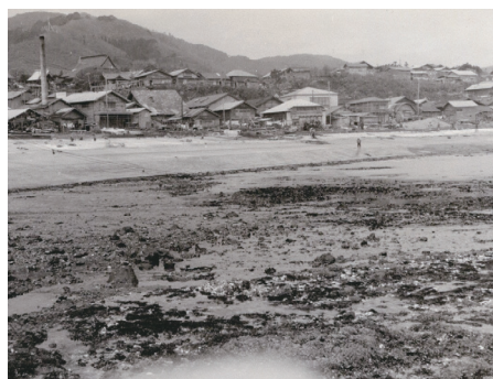
十勝沖地震 泊 間の口漁港 潮引き