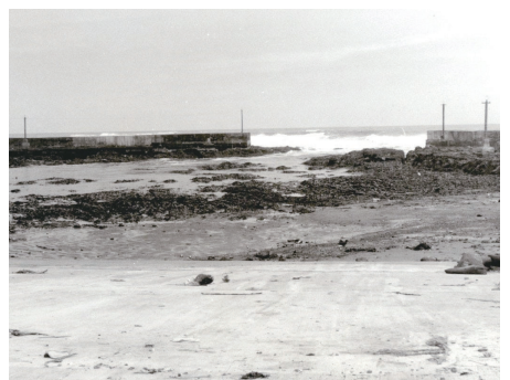
十勝沖地震 泊 間の口漁港 津波