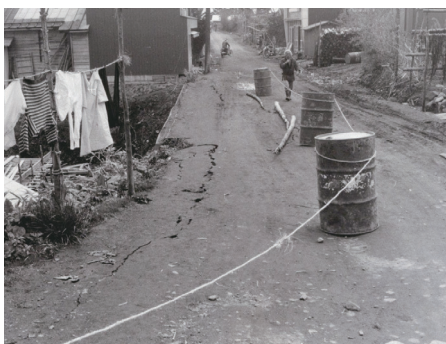
十勝沖地震 泊 道路に亀裂

大地震を恐れ、平穏を求める人の心がまじないとして遠く六ヶ所村まで伝わったのではないだろうか。コロナパンデミックではアマビエが流行ったように、制御不能なことに対し、いつの時代も人々は祈り、すぐるものを求めてきた。科学が進んだ現代でも災害を恐れ、何かをすぐろうとする思いは昔も今も同じだと考えさせられた。